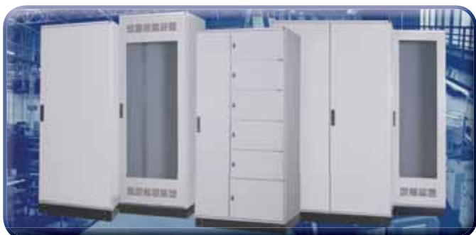
ED - Schaltschränke IP 55