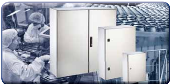
EX - Edelstahlwandgehäuse IP 66