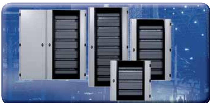
EE - Verteilergehäuse IP 55