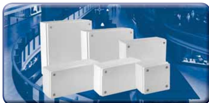
ET - Klemmkästen IP 67