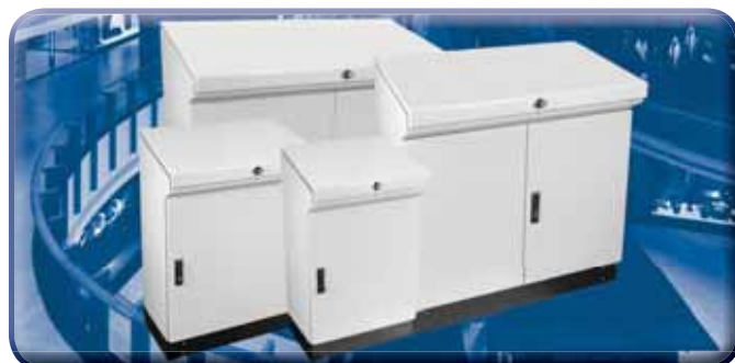
EK - Pultsysteme IP 55

Die abgebildeten Gehäuse der Serien ED / EE / EK / ET können in unterschiedlichen Materialien, wie z. B. Aluminium oder Edelstahl hergestellt werden.