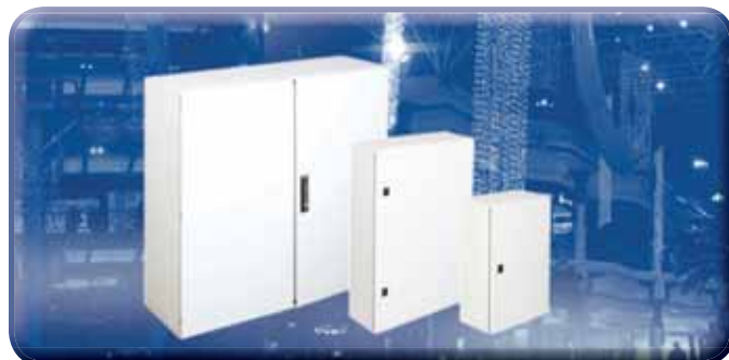
EO - Stahlblechwandgehäuse IP 66